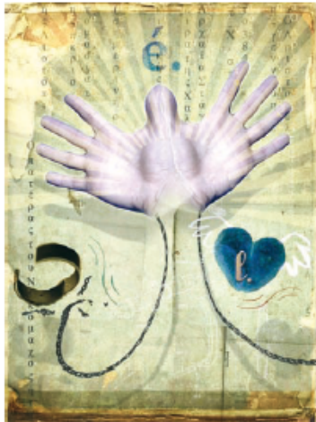
Fig. 2.2. La interpretación aristotélica del conocimiento.

Abstracción. Operación cognoscitiva mediante la cual, a partir de los datos sensibles que nos suministran nuestros sentidos, el entendimiento obtiene las esencias universales contenidas en las cosas.