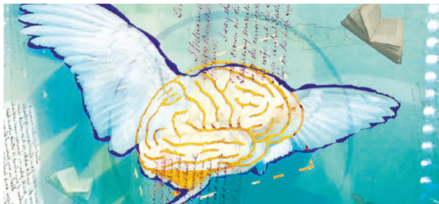
Fig. 2.6. Para Aristóteles el alma es la forma del cuerpo.