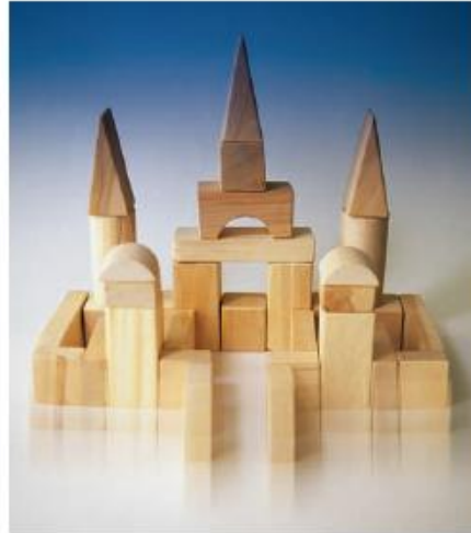
Fig. 2.5. Troncos de madera y escultura. En todo movimiento permanece la materia y cambia la forma.